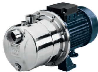
JEX / JESX Motor de aletas