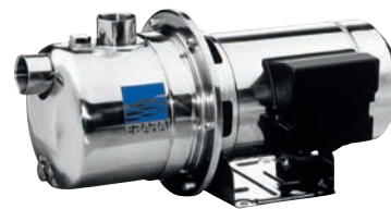
JE / JES Motor encapsulado